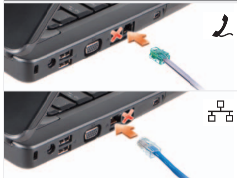
连接调制解调器和网络（电缆未包括）